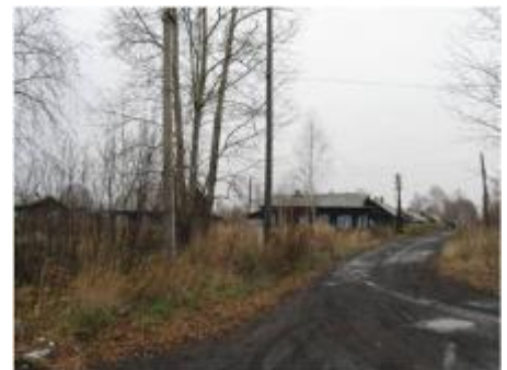
Улица Германа Панфилова